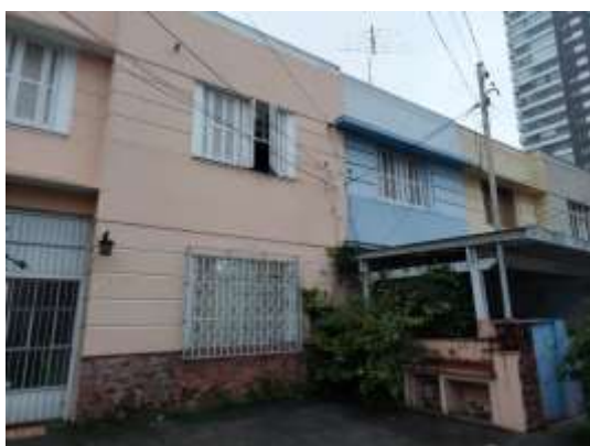
Imagem 6 - Fachadas das residências