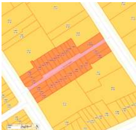
Imagem 2 - Demarcação do conjunto e lotes