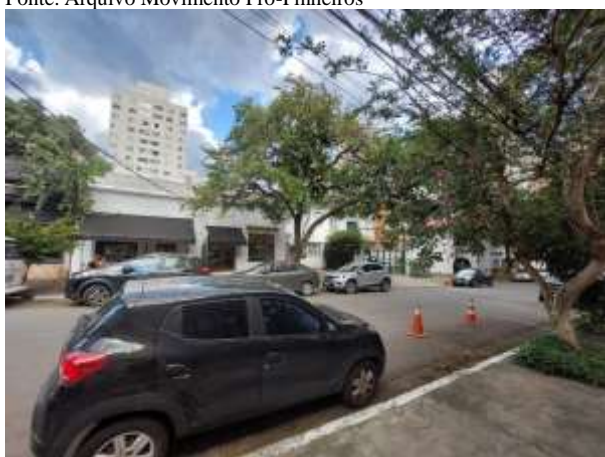
Imagem 5 - Fachadas das casas, ocupadas com comércio.