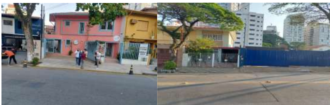
Imagem 5 - Comércio locais; Imagem 6 - Residência e tapume de obra - futuro edifício compromete a insolação e ventilação local