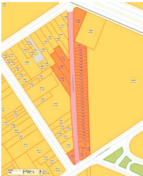
Imagem 2 - Demarcação do conjunto e lotes