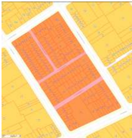
Imagem 2 - Demarcação do conjunto e lotes