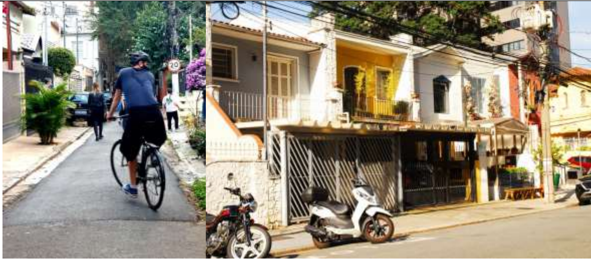
Imagens 7 e 8 - Movimento local: passagem no interior do conjunto e pequenos comércios nas vias circundantes