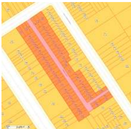
Imagem 2 - Demarcação do conjunto e lotes