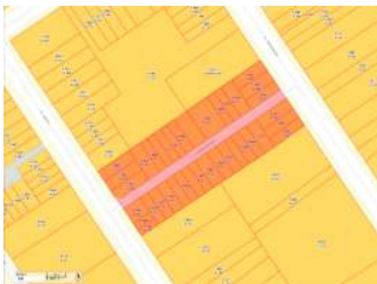
Imagem 2 - Demarcação do conjunto e lotes