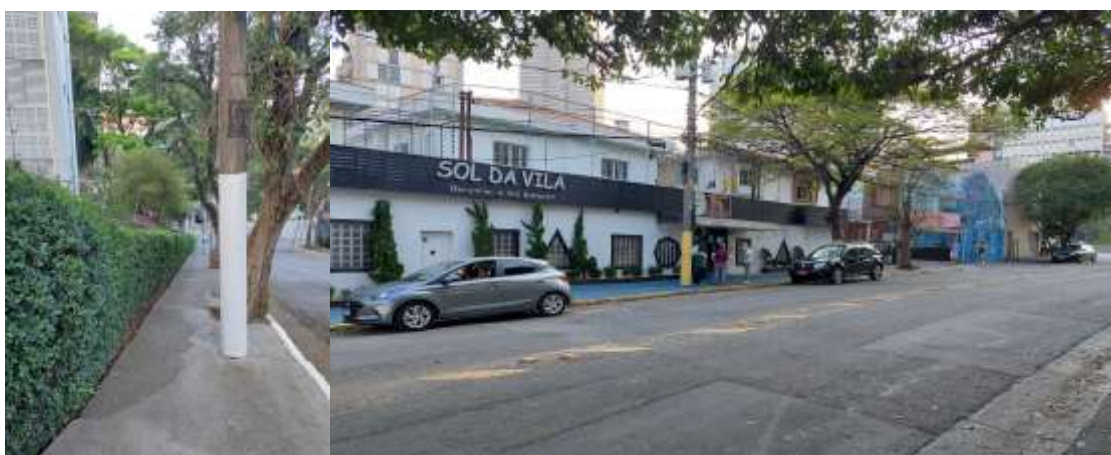
Imagens 3 e 4 - Ruas da região: relevo acentuado e presença de comércios e serviços