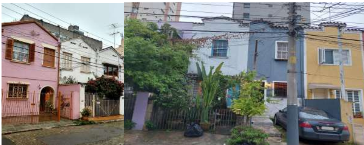
Imagens 5 e 6 - Variações construtivas originais apresentadas em fachadas preservadas