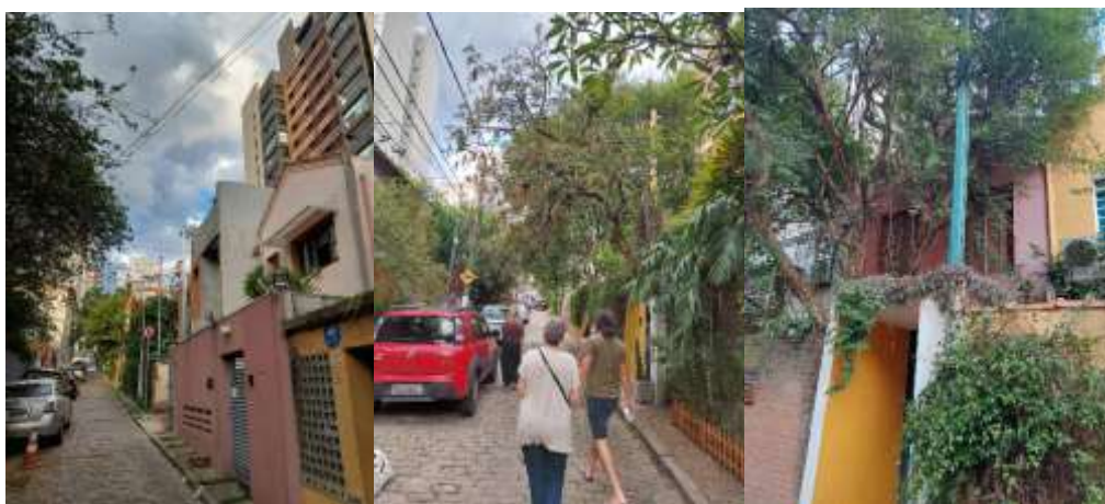
Imagens 3 e 4 - Ambiência do conjunto e passagem de pedestres; Imagem 5 - Detalhes das residências