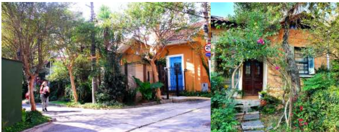
Imagens 5 e 6 - Residências com fachadas preservadas, muitas mantêm o padrão original da vila