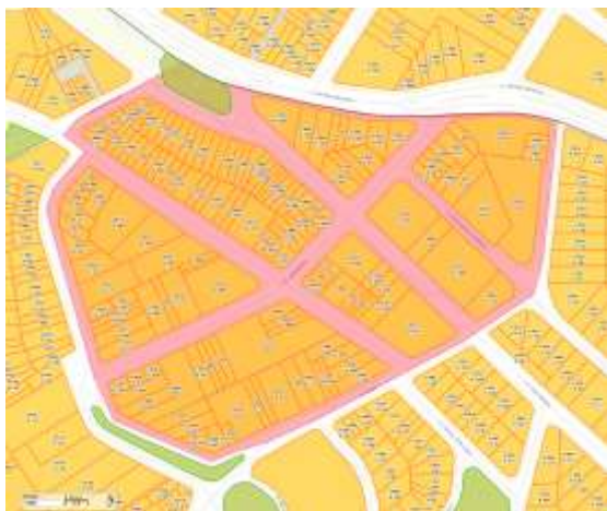
Imagem 2 - Demarcação do conjunto, quadras e lotes