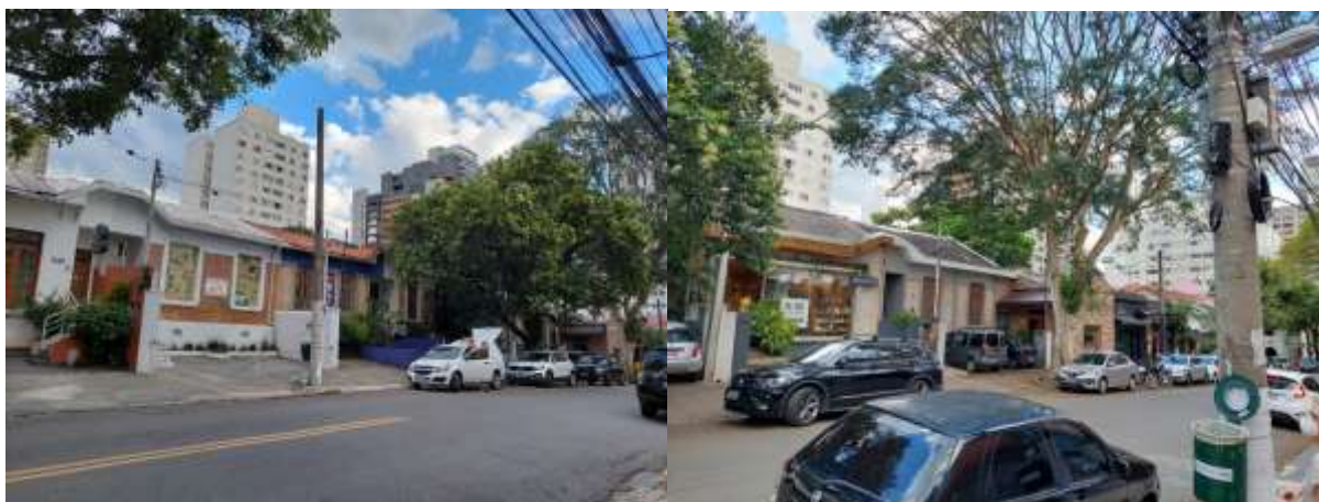
Imagem 3 e 4 - Ambiência do conjunto e passagem; arborização significativa.