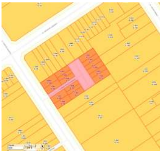
Imagem 2 - Demarcação do conjunto e lotes