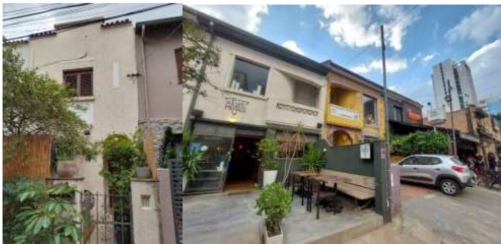
Imagem 6 - Fachada de residência no interior da quadra; Imagem 7 - Comércio local (vias externas)