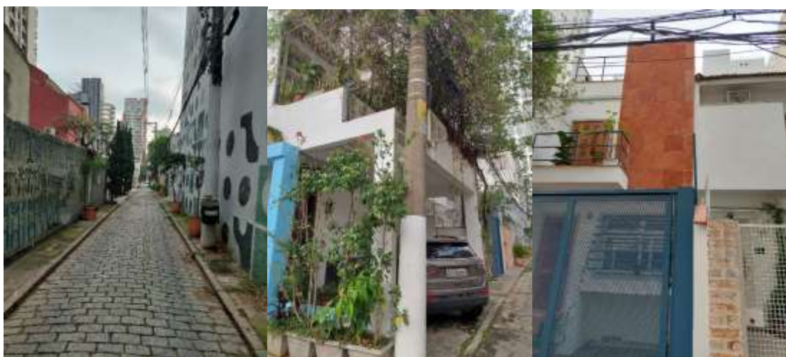
Imagem 3 - Ambiência do conjunto e passagem; Imagens 4 e 5 - Detalhes de residências no interior do conjunto