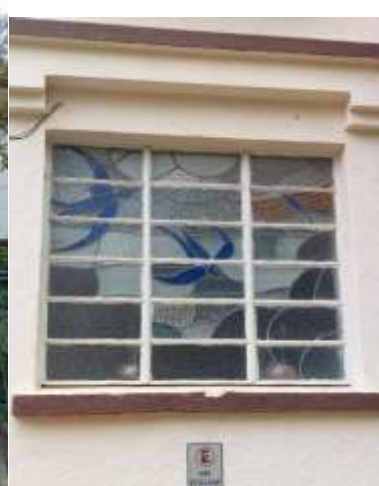
Imagens 3, 4 e 5 - Fachadas preservadas pela maioria das unidades; Imagem 5 - Detalhes de vitrais estilo art-déco