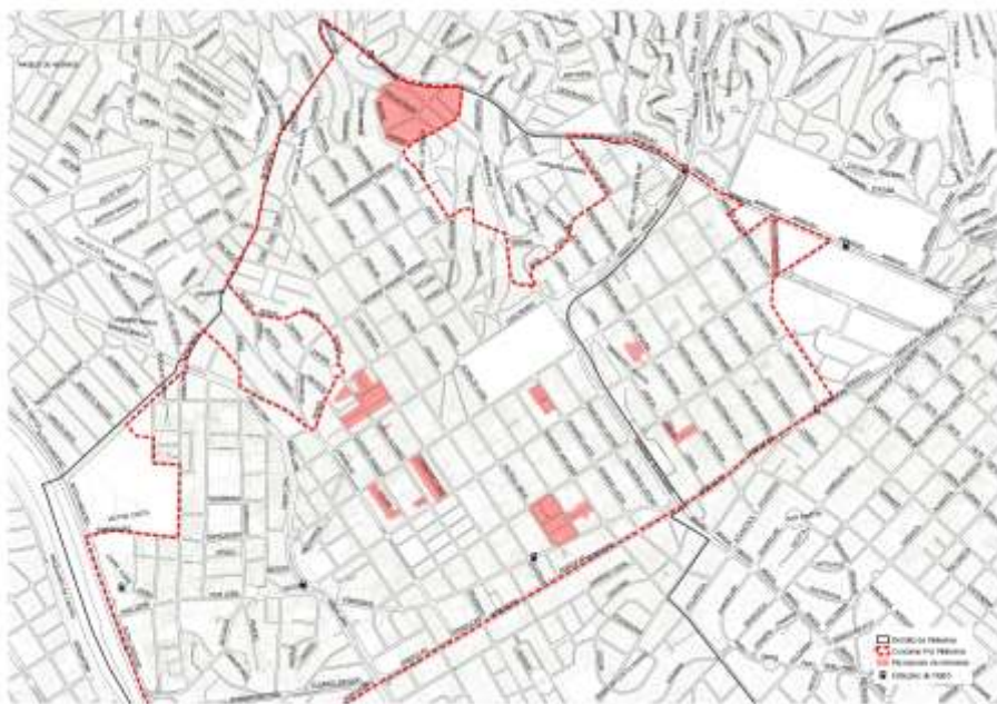
Mapa parcial e aproximado das microzonas solicitadas

(aqui há outras fora da ZEUs, desconsiderar)