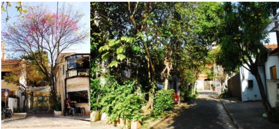
Imagem 3 - R. Dr. Virgílio de Carvalho Pinto com R. Paschoal del Gaizo; Imagem 4 - Via arborizada interna ao conjunto