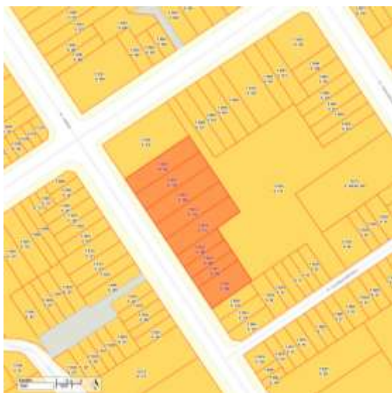
Imagem 2 - Demarcação do conjunto e lotes