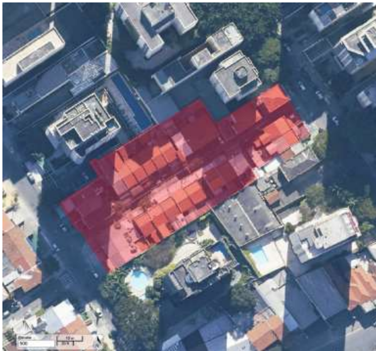
Imagem 1 - Foto aérea da zona de interesse