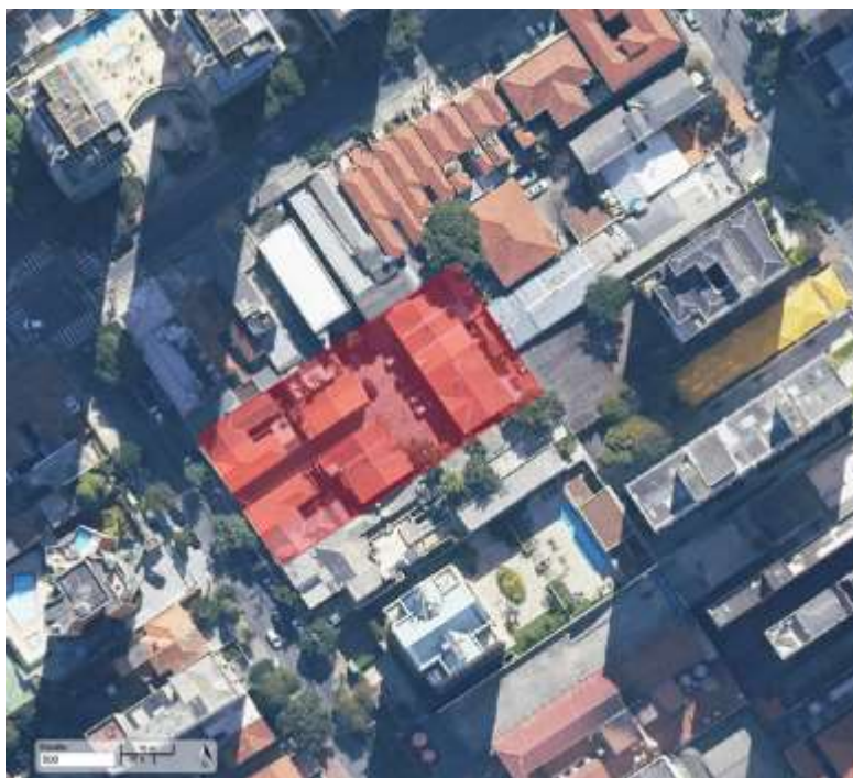
Imagem 1 - Foto aérea da zona de interesse