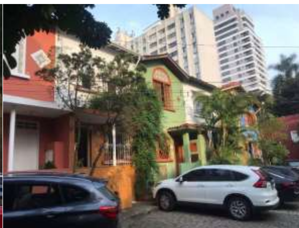
Imagens 3 e 4 - Fachadas das residências no interior do conjunto